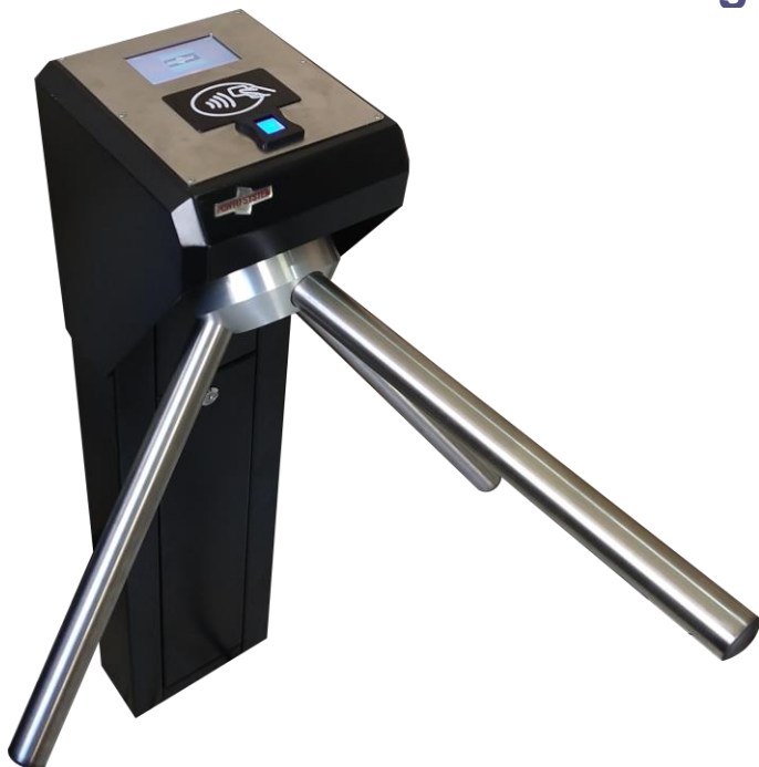
Preta com peças em Inox